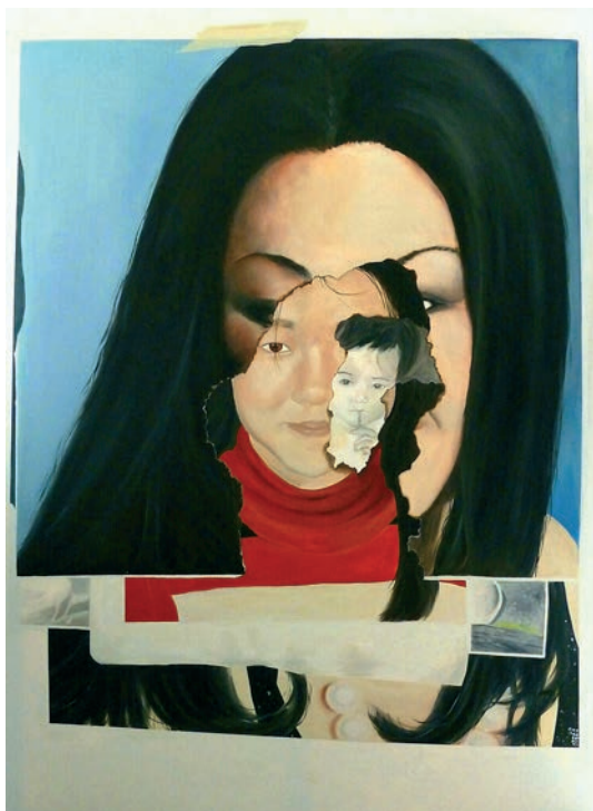
The Empress Between Us

Mina konstverk är resultatet av en process där jag utforskar mitt kulturella arv. Jag vill undersöka och försöka förstå hur det är att vara född i en kultur och sedan adopterad in i en annan kultur – en resa som tagit mig från en kultur till en annan mycket annorlunda kultur flera tusen mil bort. Genom att använda familjealbum som källmaterial undersöker jag arv och miljö genom verkliga men också påhittade platser.