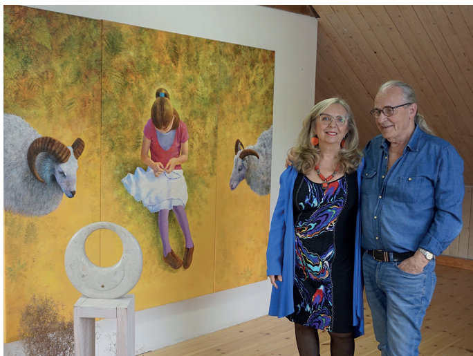
Konstnärsparet i ateljén i Uttersberg i maj 2022

Jag kom till Sverige och Upplands Väsby hösten 1981 med en resväska på 17 kg i ena handen och min lille son i den andra. Det fanns också många drömmar och en yrkesutbildning i bagaget. Allteftersom tiden gått och resan fortsatt har förutsättningarna blivit större och vyerna vidgade.