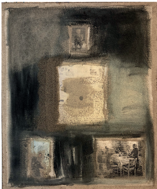
Livets ömma hänsynslöshet