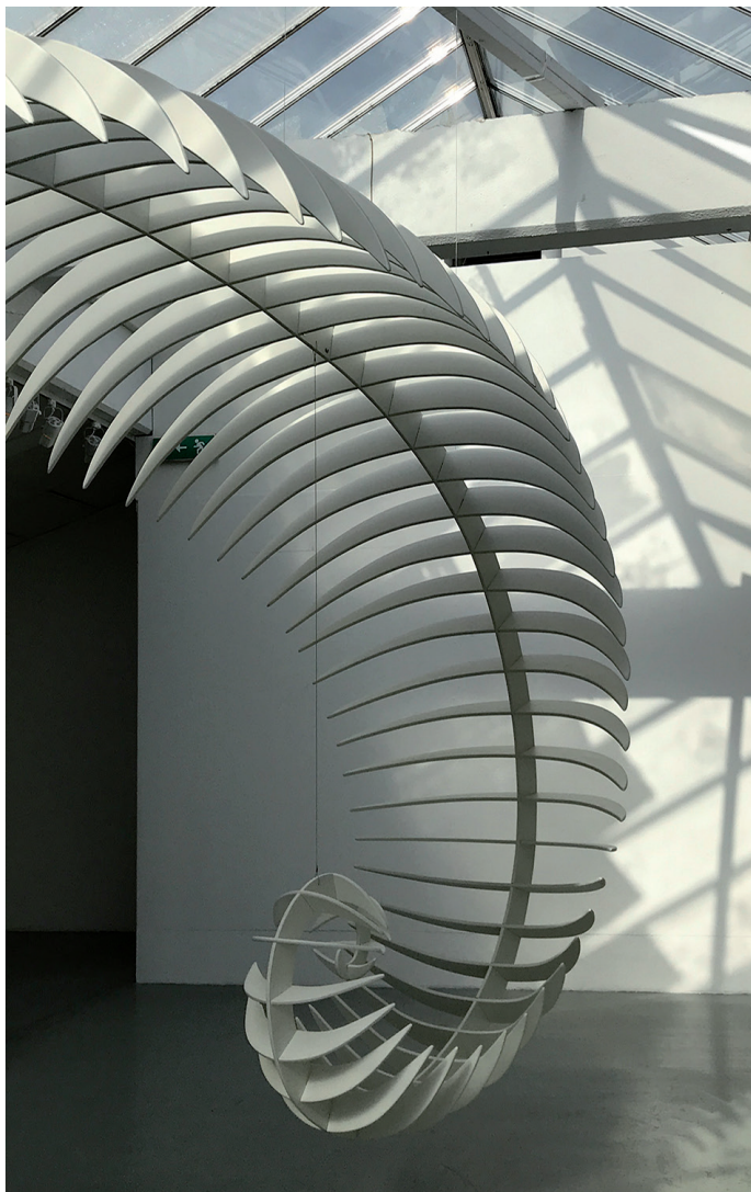
Gunilla Poignant: En tanke om tiden