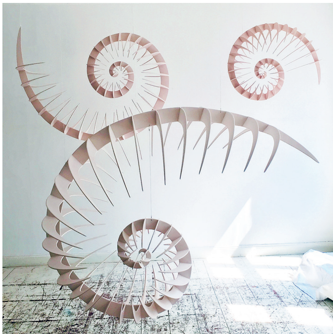
Filis Spiralis, Konstnärligt uppdrag till Järfälla kommun 2019

Jag arbetar med skulptur, objekt och installation, inför utställningar och med offentliga uppdrag runt om i landet. Mina verk handlar ofta om motsatsförhållande, där ljus och luft har stor betydelse. Mitt formspråk har ett ursprung från organiska former. Jag arbetar gränsöverskridande i de flesta material. Materialet är en bärande del i processen och tematiken handlar ofta om vår existens i ett oändligt universum.