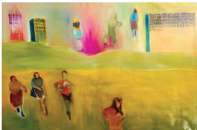
Where are you going

Jag inspireras av min samtid och har ofta arbetat med teman som rör kvinnor. Jag är utbildad i England och kanske märks det i mina bilder?