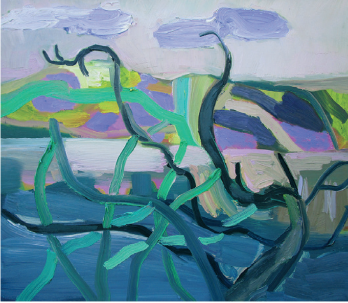
Ris och ros