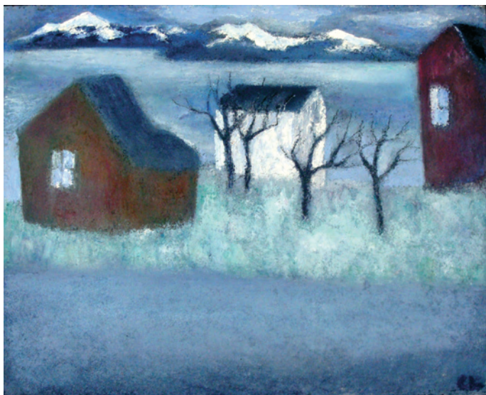
Vår i Vadsö

Mina motiv är natur, människor och stilleben.