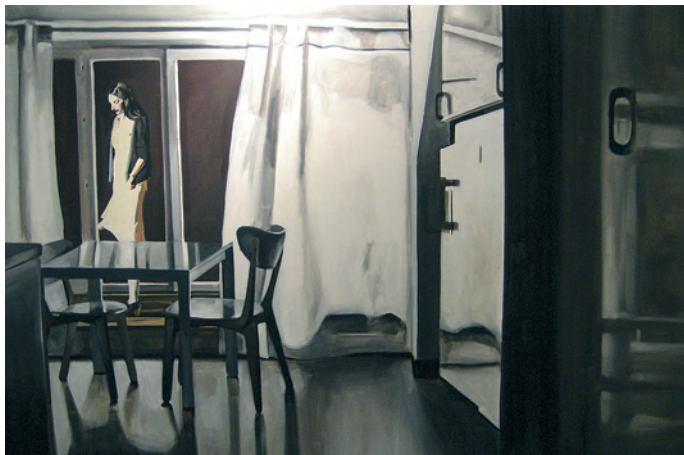
Reflektioner i det högblanka

Måleri för mig handlar om berättande. Jag ser mig själv som författare, jag vill fånga och beskriva, fast med bilder. Att arbeta konstnärligt är att studera mänskligheten, ett av de få yrken som värdesätter relationer till varandra och hur vi förhåller oss till vår tillvaro. Det viktiga är att beröra betraktaren, beröra Dig. Ser Du det jag ser och vill beskriva eller ser Du något helt annat? Huvudsaken är att det Du ser har en betydelse och ett värde.