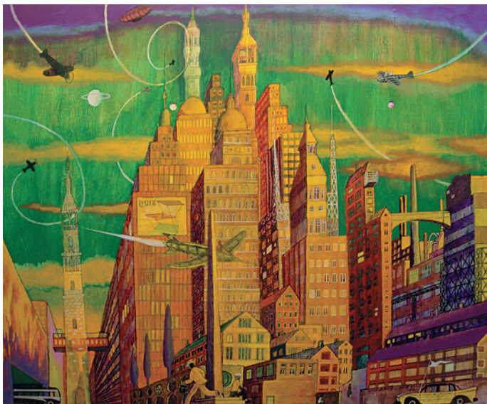
Kapitulation nr 2

Mina bilder är i grund och botten ett försök att säga något ordlöst, eftersom måleri är en ordlös verksamhet. Förklaringar har en tendens att tynga ner ... och spika fast betydelser.