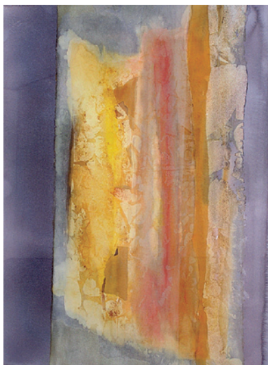
I betraktarens öga I av Ylva Sager, mottagare av Karin Öje-Abels akvarellstipendium 2008

Blir det bra respons är en ny tradition född på Väsby Konsthall!