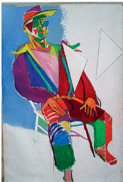
Mannen från Pajala